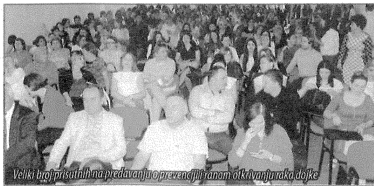
Veliki broj prisutnih na predavanju o prevenciji i ranom otkrivanju raka dojke