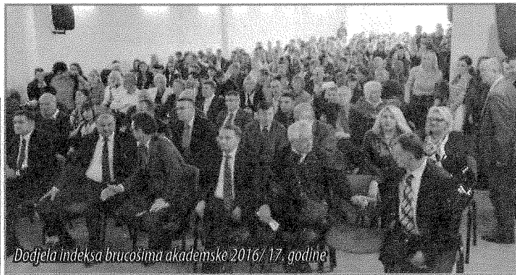
Dođjela indeksa brucosiima akademске 2016/17. godine

Otkako je prije nešto više od godinu dana upriličeno svečano otvaranje, Evropski univerzitet „Kallos“ u Tuzli privlači veliku pažnju, kako srednjoškolaca, tako i studenta sa drugih visokoškolskih ustanova. Riječ je o jednom moderno opremljenom univerzitetu koji svojim studentima pruža vrhunske uslove školovanja. U okviru šest fakulteta, Evropski univerzitet „Kallos“ uspješno realizuje licencirane studijske programe na sva tri nivoa studija, i to iz oblasti pravnih, političkih, ekonomskih, pedagoških, tehničkih i zdravstvenih nauka. Najbolji dokaz, za pomenuti kvalitet i uspješan rad, su studenti koji ne kriju svoje zadovoljstvo. Neki od njih su studenti po prvi puta, a neki od njih su prelaznici sa drugih visokoškolskih ustanova.