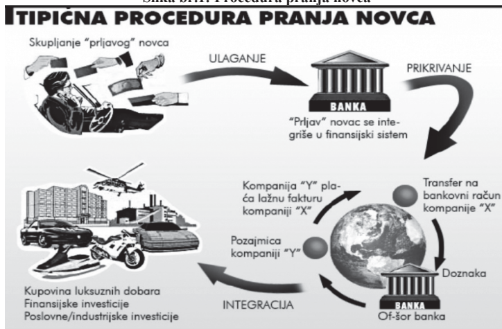
Slika br.1: Procedura pranja novca